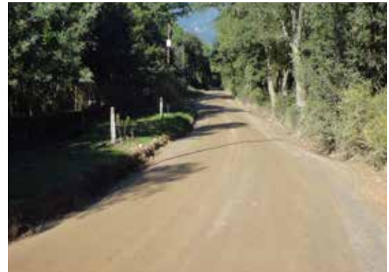
Camí de Sant Martí de Montnegre

D'altra banda, l'ADF Forestec ha arranjament, dins el programa de prevenció d'incendis forestals PPI 2014, els camins previstos per aquest any, tres a les serres del Montseny i tres més a la zona d'Olzinelles. I a Penyes , el passat mes d'octubre es va dur a terme un arranjament al camí amb l'objectiu principal de millorar la seguretat respecte a la proximitat de la via del tren i mantenir el ferm en un bon estat de funcionalitat.