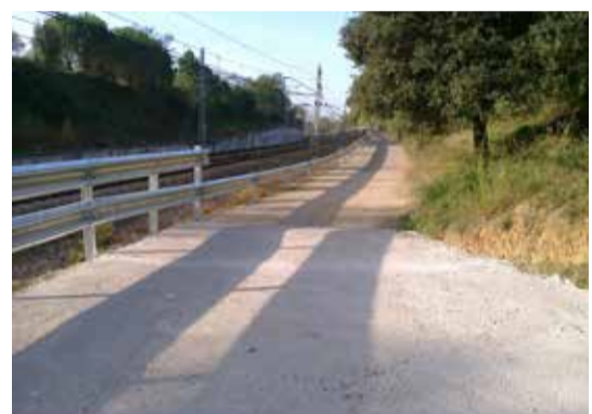
Camí de Penyes