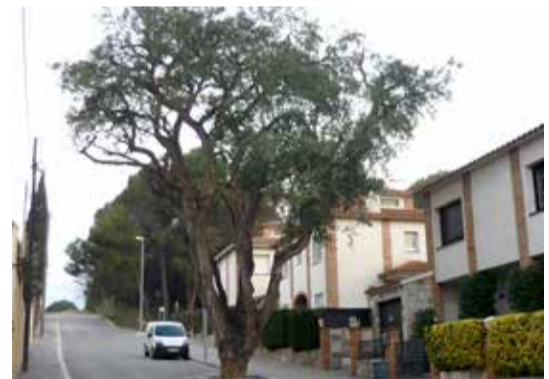
L'Alzina surera del carrer Eduard Domènech, just després de la poda i aclarida el febrer de 2014

L'aplicació de les pautes que marca l'Estudi sobre els treballs fitosanitaris que es realitzen en l'arbrat viari i zones verdes de Sant Celoni ha donat bons resultats. Durant aquest any s'ha pogut constatar una millora important en diferents aspectes: s'ha evitat la proliferació de les plagues per insectes xucladors i fongs en l'arbrat viari; s'ha aconseguit reforçar la vitalitat de la surera del carrer Eduard Domènech; s'ha fet un desherbat manual en voreres i carrers que ha fet millorar molt perceptiblement el seu aspecte; s'ha reduït de 10 a 6 el nombre de zones tractades amb herbicida i la despesa dels serveis externs ha estat molt menor perquè el tractament plaguicida ha estat el de fumigació en lloc de l'endoteràpia.