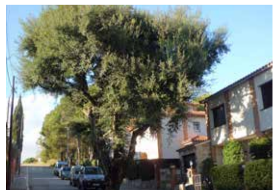
L'Alzina surera a l'octubre de 2014, amb un aspecte molt bo