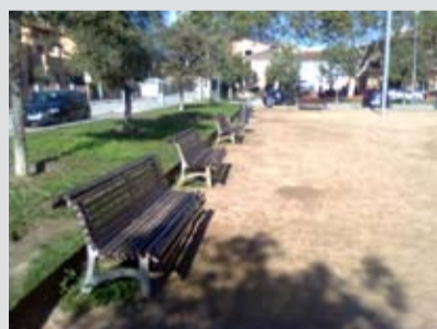
Reparació de bancs a la Batllòria i al passeig del Cementiri