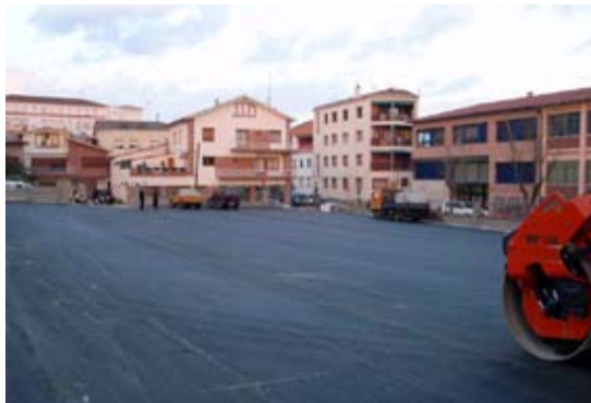
L'aparcament estarà acabat la segona quinzena de desembre

Durant la segona quinzena de desembre es posarà en funcionament el nou aparcament públic del carrer Campins amb una capacitat per a 90 vehicles. L'aparcament s'ha construït als terrenys on hi havia el dipòsit d'aigua de la Salle un cop han entrat en funcionament els nous dipòsits de Can Sans. El nou aparcament es troba en un emplaçament estratègic per la seva proximitat a la zona comercial i també per la seva proximitat a l'Hospital.