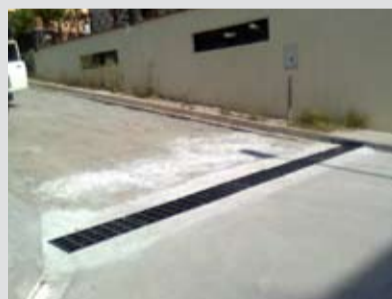
Instal·lació d'una reixa al c. Aribau per tal de mitigar l'efecte de l'arrossegament de terres al c. Pitarra