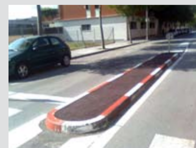
Reparació de les illetes al carrer Lluís Companys