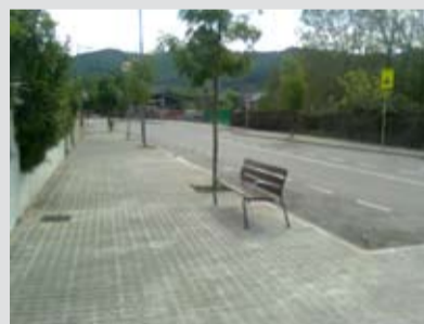
Un nou banc a la ctra. de Gualba