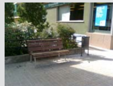
Noves papereres a l'avinguda de la Pau i al c. Bellvert