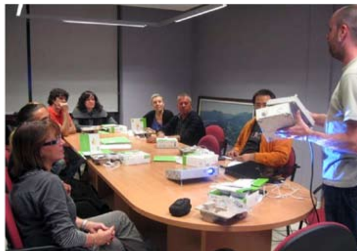
Reunió explicativa amb els participants a la prova pilot

Un cop finalitzada la fase pilot i d'acord amb els resultats obtinguts i dels recursos disponibles, l'Ajuntament decidirà si s'amplia la cessió de comptadors a totes les famílies que ho sol·licitin.