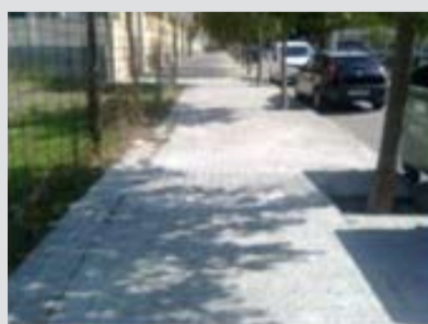
Arranjament panots als carrers Mn. Jacint Verdaguer i Sant Roc