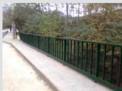
Rascat i repintat de la tanca del pont d'accés a l'escola Pallerola