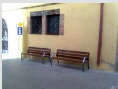
Instal·lació de bancs i jardineres al c. Major de Dalt i al c. Anselm Clavé