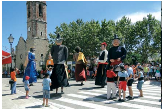
Diumenge al migdia els gegants de la Batllòria, amb les colles convidades van animar els carrers del poble. Tot i la calor ningú s'ho va voler perdre i els veïns van ajudar a refrescar els geganters i geganteres amb aigua. Tot junts van xalar amb el so de les gralles !.