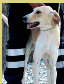
Nom: Max Gènere: Mascle Raça: Mestís Edat: 1 ò 2 anys