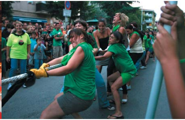
El dilluns 6, a 2/4 de 8 del vespre, a l'avinguda de la Pau, última prova del Corremonts: l'estirada de corda, com sempre, va ser un èxit! Els Negres es van endur el punt infantil i els Senys el masculí i femení adult.