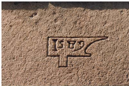
La data de construcció de l'habitatge dins d'una enclusa de ferrer, ofici del cap de casa

A Sant Celoni hi ha diversos habitatges dels segles XVI i XVII, que són les cases de poble més antigues que s'hi conserven. Algunes tenen la data inscrita a la llinda del portal o d'una finestra, d'altres tenen elements, com les finestres conopials, que són característics del segle XVI. Aquestes cases posen de manifest el creixement de la vila al llarg del carrer Major: des de la Força o muralla medieval cap a la plaça de la Vila i més enllà de la plaça del Comte del Montseny fins al barri de la Vilanova.