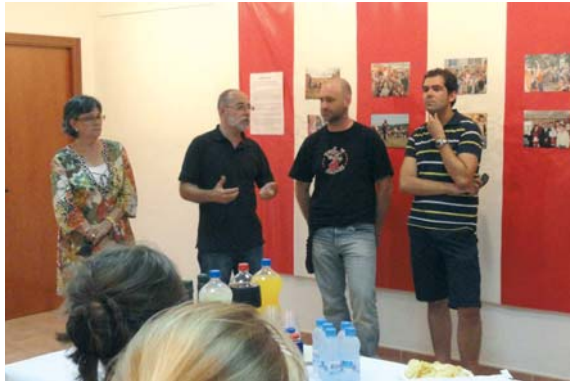
Divendres es va inaugurar l'exposició fotogràfica de Trup de Nassos on es mostren els projectes que aquest grup de pallsos va fer als pobles del Senegal on l'ajuntament hi té projectes de cooperació en marxa.

Els dies 20, 21 i 22 d'agost la Batllòria va viure la seva festa major. Dies de molta gent i molta gresca amb activitats per a tots els públics.