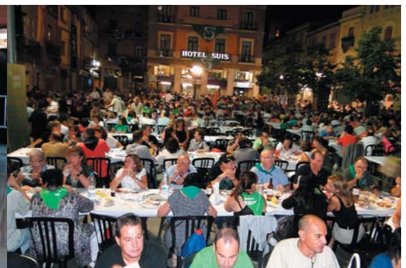
Mil persones van sopar a la plaça de la Vila al, ja mític, sopar popular. Aquest any seguit de les havaneres dels Pescadors de l'Escala i cremat de ro.