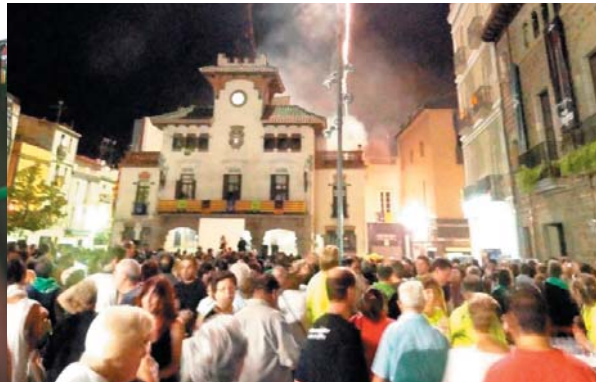
El tancament de festa es va fer a la plaça de la Vila plena de gom a gom. Tothom volia saber el veredicte del Corremonts 2010, veure fotografies de la festa, lip dubs, coca i cava i... pirotècnia de la Colla de Diables pel fi de festa i...fins l'any vinent!!