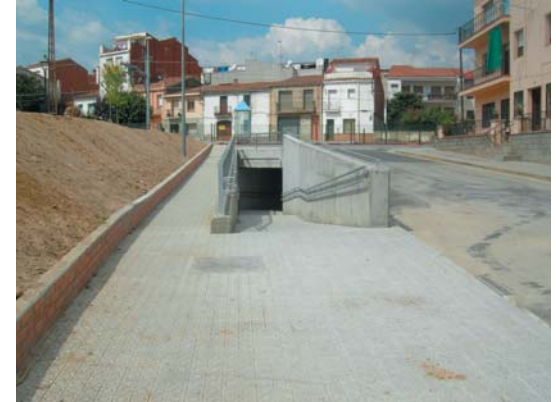
Accés al pas soterrat des del carrer de les Canàries