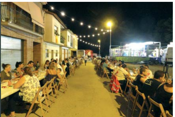
Dissabte, al carrer Major, al costat de l'envelat, tot estava a punt per a rebre les 300 persones que van sopar plegades. El menú: botifarra, xai, mongetes, pa, vi, aigua, gelat i cafè... va ser popular i tothom qui va voler va tenir lloc a taula. Un cop sopats cap a l'envelat amb l'orquestra Aquarium.