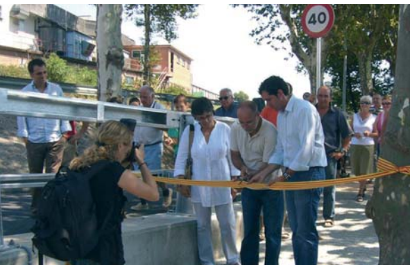
Dissabte al migdia es va inaugurar el pas soterrat de la C35 d'accés a l'estació. Una gran millora molt esperada per la gent de la Batllòria.