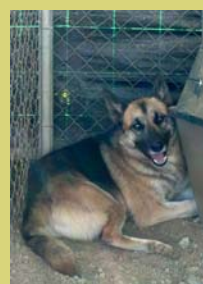
Nom: Negrito Gènere: Mascle Raça: Pastor Alemany Edat: 3 anys