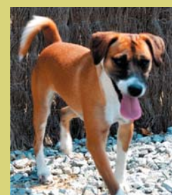
Nom: Noa Gènere: Femella Raça: Mestissa Edat: 1 any