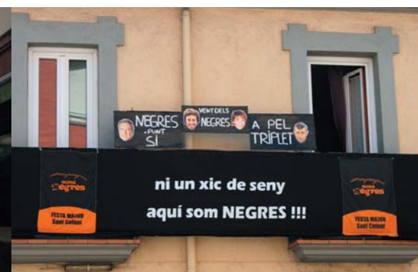
Els Negres però... també van fer bona feina enguany. "Ni un xic de seny" el seu lema!