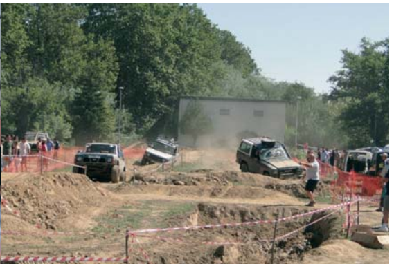
Durant tot el cap de setmana els 4x4 van gastar molta benzina al camp de la Roca Umbert. Grans i petits van admirar les habilitats d'aquests conductors agosarats. Molta participació per a una activitat que any rere any va agafant més volada.