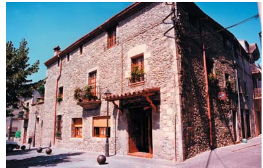
La façana de Can Mai Tanquis va aprofitar un pany de la muralla, quan aquesta ja no tenia funció defensiva

Bestiar, 1). El 1589 s'hi van obrir el portal i la finestra, a la llinda de la qual hi ha una invocació religiosa protegint l'edifici: JESUS MARIA.