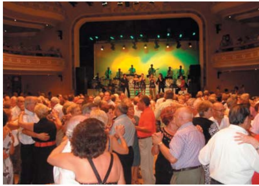
Després del concert, ball de fi de Festa amb l'Orquestra Costa Brava a la Sala Gran de l'Ateneu.