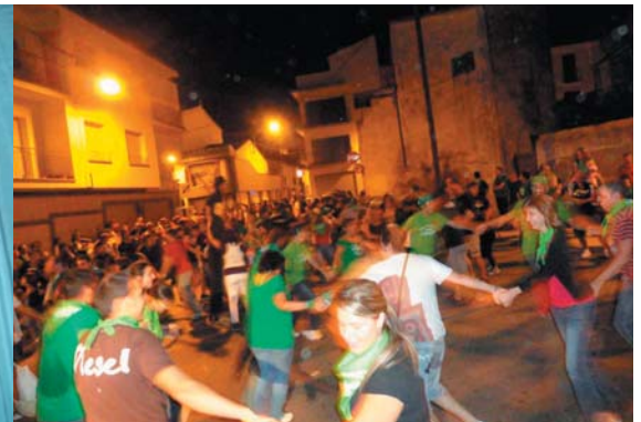
Comiat del Correxarrups a la plaça Joaquim Sagnier, a tocar de l'espai barraques. Una prova que es va endur els Senys, 3'5 punts, els Negres només van poder esgarapar 1/2 puntet...