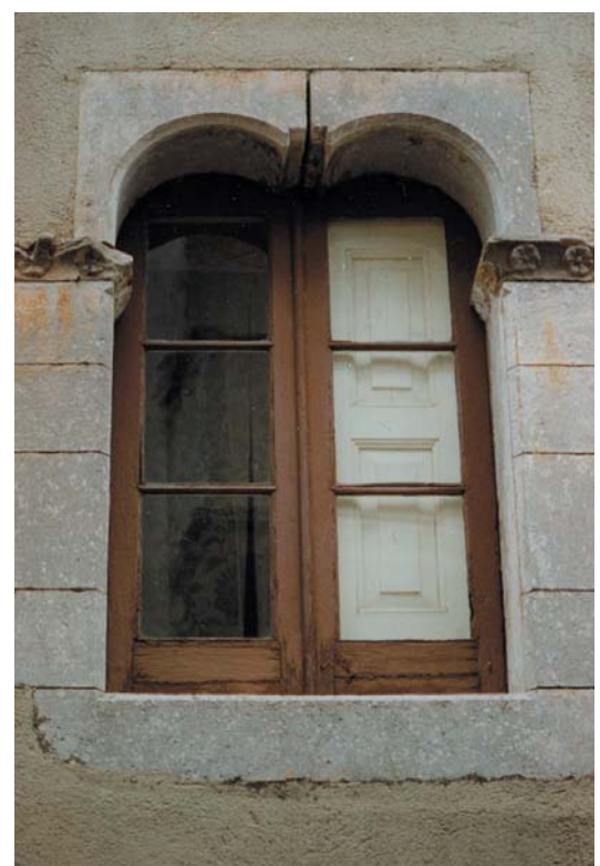
Elegant finestral del casal dels Julià, que eren batlles de la vila, situat al carrer de Bellver