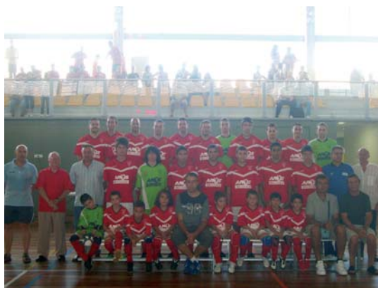
La presentació dels equips va tenir lloc dissabte 11 de setembre al Sot de les Granotes