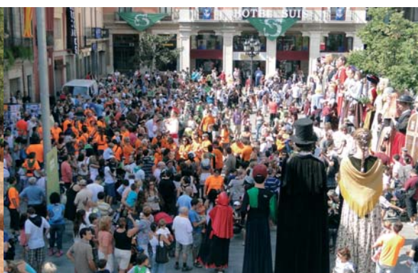
Diumenge la Trobada de Gegants i Capgrossos va recórrer els carrers de Sant Celoni, des de la plaça de la Vila fins el Cardelús on començava la Rucada.