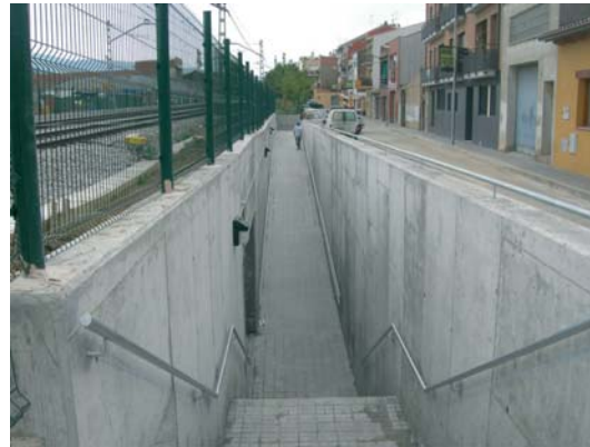
Pas soterrat al carrer Santiago Rusiñol

Amb l'obertura dels dos accessos inferiors de les vies del tren als carrers Santiago Rusiñol i Olzinelles aquest mes de setembre, Sant Celoni ha acabat amb els passos a nivell. Després de molts anys de retard finalment el Ministeri de Foment ha executat el projecte per abolir els perillosos passos a nivell. Aquestes actuacions completen el projecte de permeabilització de la via del tren iniciada amb el pas soterrat al carrer Roger de Flor, inaugurat el mes de març.