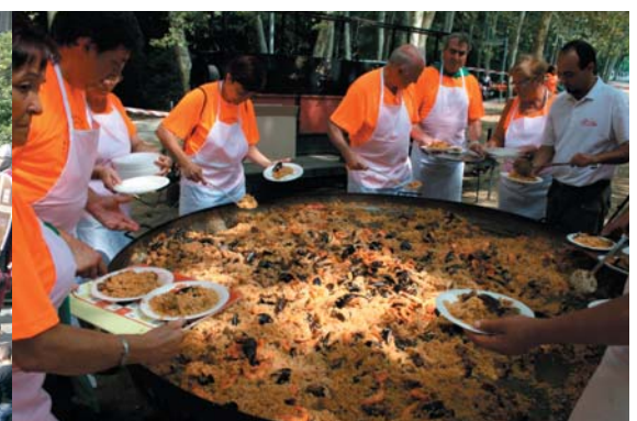
La ja tradicional arrossada popular aquest any va ser diumenge, seguida de l'Orquestra Sant Celoni que va fer ball per a grans i petits.