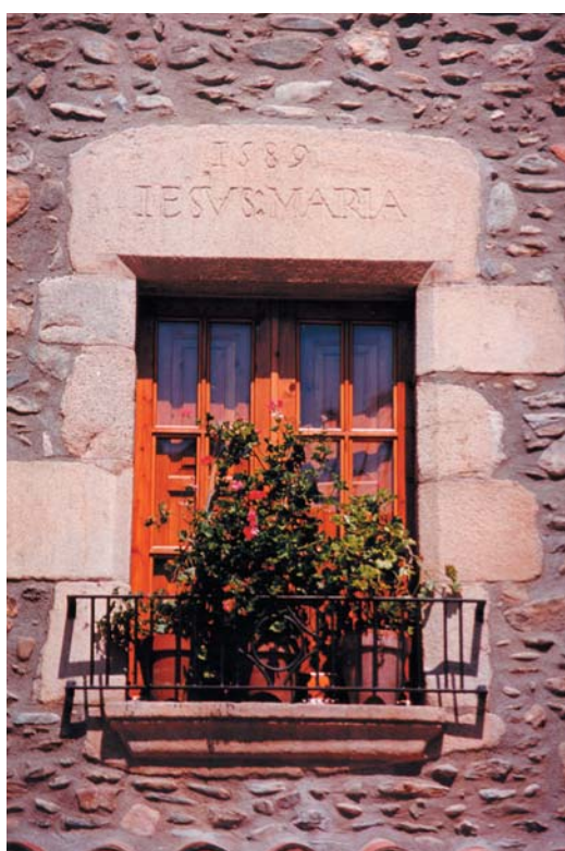
Baix centre: Finestra de can Mai Tanquis, amb l'any que la van construir (1589) i una invocació religiosa: Jesús, Maria