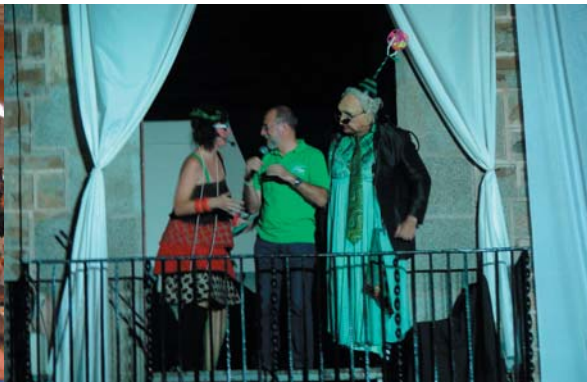
El tret de sortida del CorreMunts va servir aquest any per presentar la Senyoreta Muntanyetes, la neboda del Senyor Monts que aquest any ha animat amb ell la Festa.