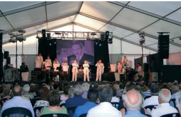
El diumenge 22 d'agost l'orquestra Principal de la Bisbal va tocar per primera vegada a la Batllòria davant un nombrós públic. Sardanes, concert i ball de nit que van omplir l'envelat de gom a gom.