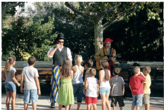
Dissabte 21 d'agost, a les 6 de la tarda, els nens i nenes de la Batllòria van gaudir de l'espectacle musical d'animació infantil amb el grup Nosaltres. Cançons i danses van amenitzar una tarda molt calorosa però on tothom va sortir i participar. A Colla Gegantera va organitzar jocs de cucanya.