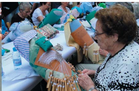
Unes 150 puntaires vingudes de 25 pobles diferents van omplir el carrer Major dissabte al matí.