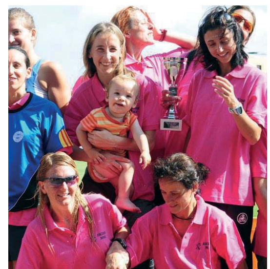
Les sis atletes al pòdium

Si vols practicar atletisme contacta amb el Club al 93 867 28 95 i www.casantceloni.com