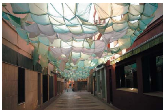
La Campanya del Senys els hi va donar el punt a aquesta colla, un exemple el passatge Sant Ramon... moltes felicitats Senys!!