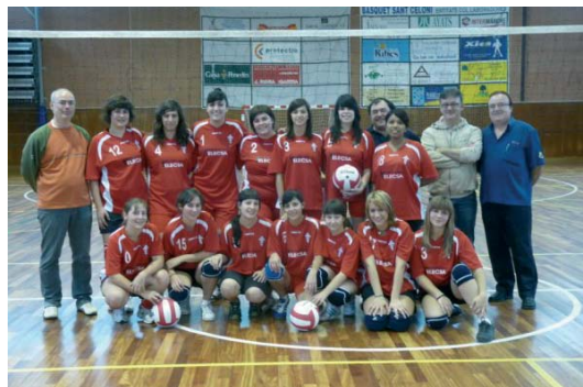
Equip sènior femení

Si vols practicar vòlei contacta amb el Club al telèfon 972 87 02 78.