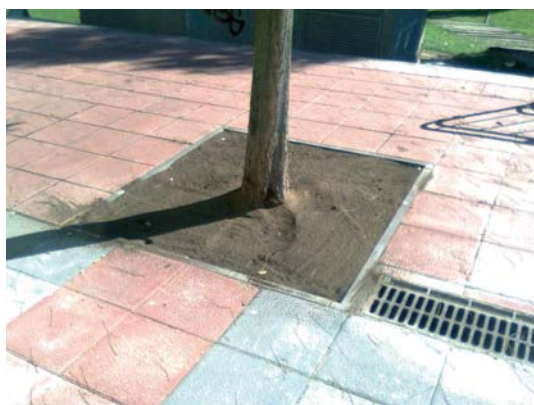
D'aquesta manera s'evita que les arrels trenquin el paviment

Recentment s'han ampliat els escocells dels arbres dels carrers 11 de setembre, Aragó, Creu Roja i Campins. Des de fa un parell d'anys, allà on la vorera ho permet, l'ajuntament està ampliant els escocells que provoquen un efecte demolidor en els paviments del voltant. És freqüent comprovar com les arrels, assedegades, busquen el nivell del terra i aixequen els panots, provocant importants deterioraments. Properament s'actuarà al carrer d'Eivissa.