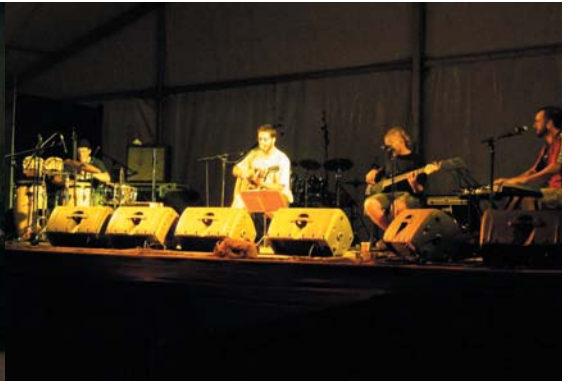
Divendres 20 d'agost, a l'1 de la matinada van començar els concerts de grup locals. Els primers van ser "la Taula d'en Velaskes" i a continuació "South to Hell". Una nit dedicada al jovent de la Batllòria i rodalies que va acabar amb la sessió del Dj Marc.