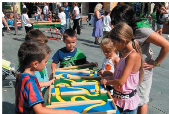
Més de 45 jocs diferents en 25 estructures de fusta van compartir la plaça de la Vila dissabte al matí amb el Mercat de l'intercanvi del joc i el llibre.