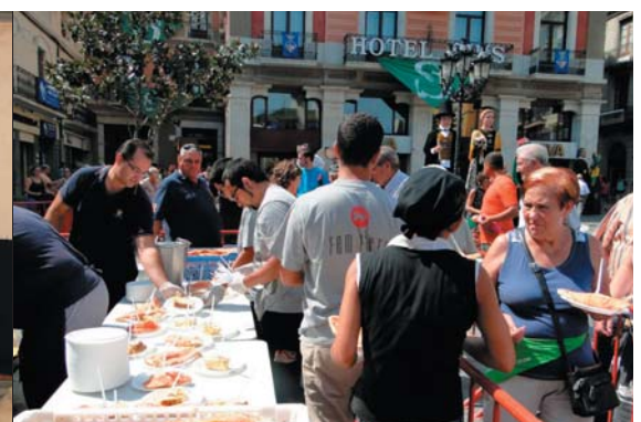
Dilluns, després de la Cursa de les ermites (nova prova puntuable del CorreMunts que aquest any va donar 3 punts als Senys) truitada popular a la plaça de la Vila!