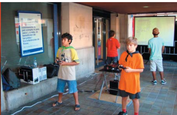
Nova prova puntuable d'aquest any pel CorreMunts! Diumenge a la tarda, a la plaça de la Vila, Concurs de playstation/wii, 1 punt pels Senys!