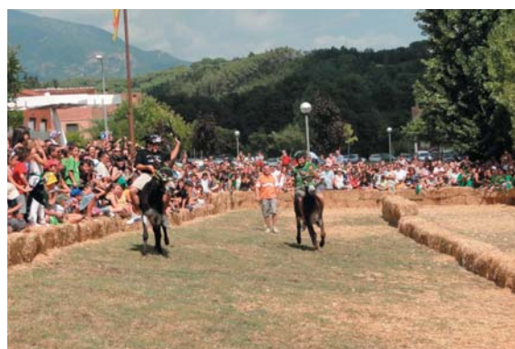
La rucada 2010 va donar 2 punta als Negres i 1 als Senys, sota un sol espectacular de diumenge de Festa Major i abans de l'Arrossada Popular, Senys i Negres... la van suar!!