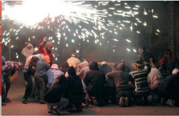
Els Diablers de Breda, U97KOU, van cremar els carrers de la Batllòria divendres al vespre. El recorregut va ser curt però molt intens. Els més valents es posaven al costat dels diablers, i els més curiosos van acompanyar els diablers amb cercavila pels carrers del poble.