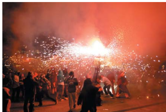
Inici del Correfoc 2010 de la Colla de Diablers de Sant Celoni a la plaça del Bestiar, que enguany celebren els 20 anys, va omplir els carrers del poble per seguir-los.