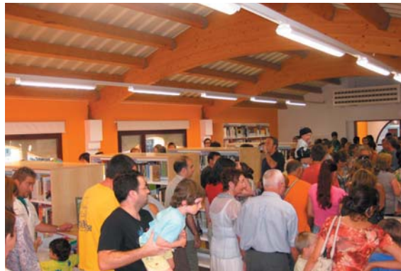
Divendres al vespre, un dels primers actes del programa de Festa Major, la inauguració del nou espai de la Biblioteca l'Escorxadador de Sant Celoni.

Sant Celoni va viure quatre dies de Festa Major plens d'activitat i de participació i amb el CorreMunts a favor dels Senys. La moguda ciutadana entorn els Senys i els Negres va superar totes les previsions amb els carrers i balcons engalanats i 9 lipdubs i fotos penjades al Facebook municipal ( www.facebook.com/ajsantceloni ). Les novetats en la programació com els canvis de dies de l'arrossada popular i del sopar popular i els nous actes com la truitada, la cursa d'ermites i el fi de festa van tenir una molt bona acollida. Podeu veure un video de resum a www.santceloni.cat/videosfestamajor