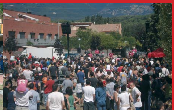
El grup Els Pets, de Constantí, va fer saltar i ballar a un públic molt nombrós, que aplegava seguidors de dues generacions.