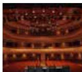
L'Ateneu Carretera Vella, 25 Teatre Municipal (Sala Gran, Sala Petita i Bar restaurant) Tel. 93 867 40 89