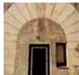
Can Bruguera C/ Major, 23 La Batllòria