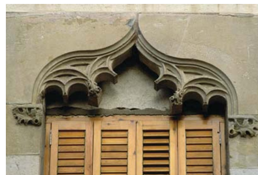
Arc conopial de Can Bonsoms, segle XVI