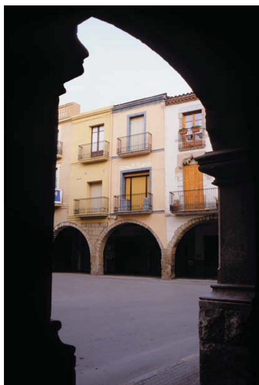
Voltes de la plaça de la Vila, segle XV - XVI

El creixement de la vila al llarg del carrer Major: el veïnat de la Torre de les Hores