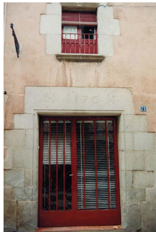
Portal de la casa Bosch, 1576