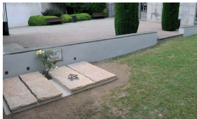
Tomba de Quico Sabaté, al cementiri de Sant Celoni. Amb motiu del 50è aniversari de la seva mort s'han realitzat obres de dignificació de l'espai