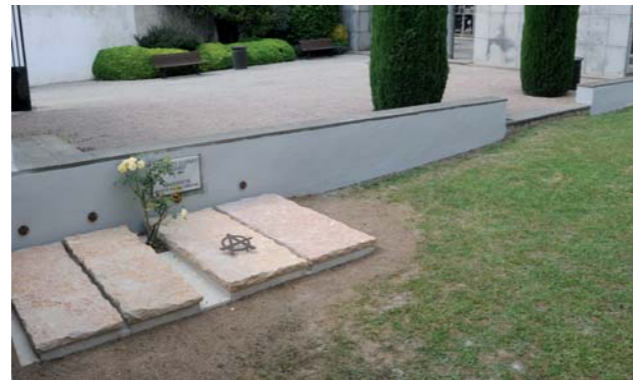
Tumba de Quico Sabaté, en el cementerio de Sant Celoni. Con motivo del 50º aniversario de su muerte se han realizado obras de dignificación del espacio

Entre 1945 y junio de 1949, siguiendo las directrices de la CNT, Sabaté cruzó la frontera furtivamente varias veces y se presentó en Barcelona para cometer atracos y difundir propaganda clandestina contra la dictadura franquista. En noviembre de 1948 un tribunal francés de Ceret le condenó por tenencia ilícita de armas y explosivos; en junio de 1949 fue detenido. Permaneció en la prisión de Lyon hasta 1952 y fue