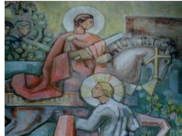
Pintures de l'altar major