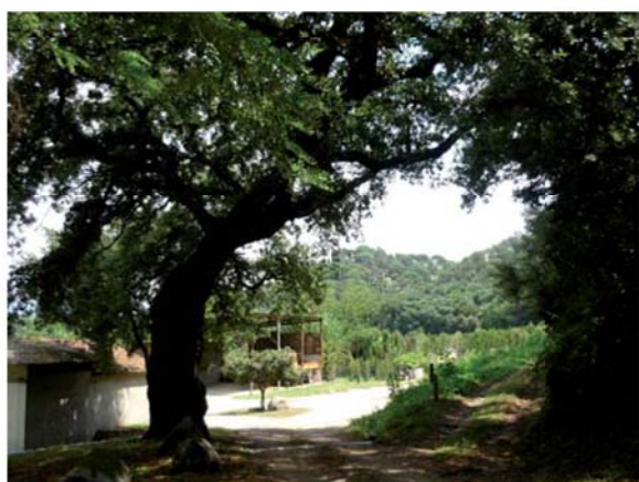
Roure del Molí d'en Coll

La passejada a peu es fa per un camí ombrejat entre el bosc i els conreus. Primer de tot trobarem l'hort del Molí d'en Coll, envoltat per un pastor elèctric perquè els senglars no furguin les hortalisses. El Molí d'en Coll, aquest mas que ens quedarà a mà esquerra, és on anaven a moldre gra les cases del veïnat de Vilardell i de més lluny. Aquest molí fariner, del qual se'n coneix la seva existència des del segle XVI, funcionava amb l'aigua de la Tordera, que s'agafava més amunt en una resclosa i es feia arribar fins a la bassa del molí a través d'un rec. La casa és gran, té una masoveria on hi devia viure el moliner i conserva bona part dels instruments de molta de la farina.