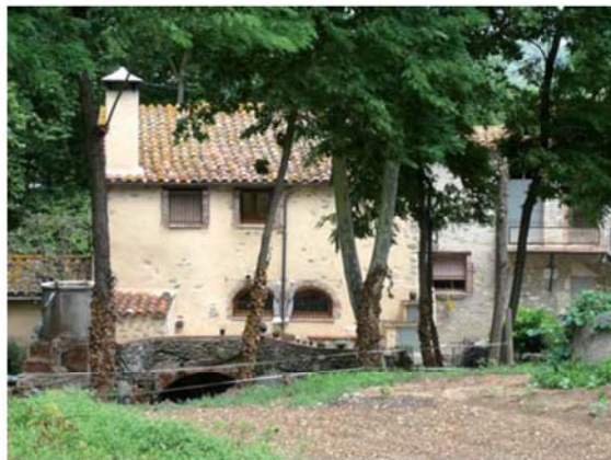
El Molí d'en Coll

Un cop travessat el pont, tombem a mà esquerra per la pista que baixa pel costat de l'autopista. Unes fites de fusta van marcant el camí per anar a peu fins a la roca del Drac tot passant prop del Molí d'en Coll i per la font de Sant Jordi i vorejant un viver de planta autòctona. En cotxe, cal continuar per la pista més propera a l'AP-7 i un centenars de metres més enllà hi ha un petit aparcament just davant la roca.