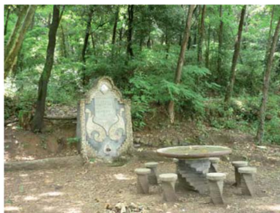
La font de Sant Jordi

De seguida s'arriba a la font de Sant Jordi, just a sota el camí. El racó és frescal, la font es troba al final d'un petit sot atapeït d'arbres, arbusts i herbes. Podreu reconèixer l'alzina, el roure, alguna alzina surera, heura, esbarzer, lligabosc, galzeran, falzia negra, herba berruguera... Com en moltes fonts, l'entorn és acompanyat per algun plàtan d'ombra, una taula i uns bancs de pedra.