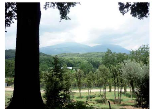
El Montseny des del camí de la font de Sant Jordi, amb el viver a primer pla