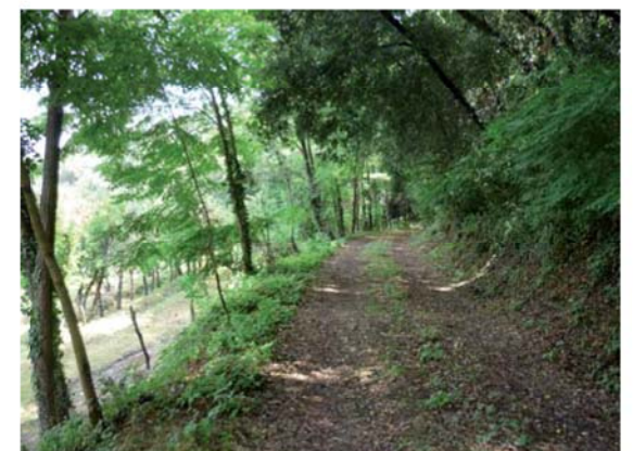
Camí de la font de Sant Jordi