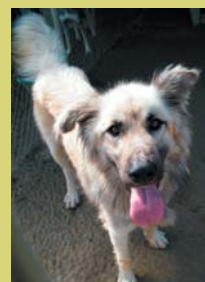
Nom: Iker Gènere: Mascle Raça: Mestís Edat: 3 ò 4 anys