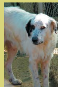
Nom: Candi Gènere: Femella Raça: Mestissa Edat: 3 ò 4 anys