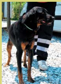
Nom: Hípic Gènere: Mascle Raça: Mestís Edat: 1 ò 2 anys

Si hi teniu interès adreceu-vos a l'àrea d'Espai públic (Tel. 93 864 12 16, c/ Bruc, 26 de 8 a 14 h) o a la Centre d'acollida Help Guau d'Argentonà (Tel. 687 69 60 11 - 687 69 60 12 - www.helpguau.com).