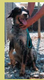
Nom: Rocky Gènere: Mascle Raça: Setter anglès Edat: 3 ò 4 anys