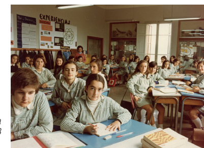
Interior d'una aula l'any 1973

A causa de la manca d'espai, les religioses van cedir part del que ocupaven i van traslladar la residència a un pis de l'avinguda de la Pau el 1979. El curs 1980-1981 va començar l'escolarització de nenes i nens junts, la coeducació. El curs següent a l'escola hi havia 3 aules de pre-escolar i, 10, d'EGB. El juny de 1986 es van inaugurar les obres d'ampliació del pati i el curs 1986-1987 es va aconseguir el concert amb la Generalitat, el concert ple es va concedir el curs 1990-1991. Mentrestant les obres continuaven: el juny de 1990 es va inaugurar la sala Magda Bach, el 1994 es van enllestir la sala taller i els vestidors i el 1996 es va renovar la pavimentació del pati.