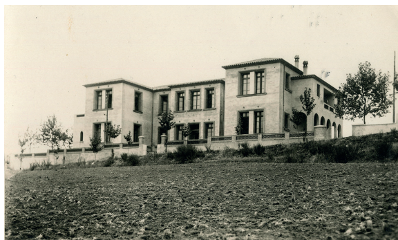
El nou col·legi inaugurat el 1948

Com que cada vegada hi havia més noies, les monges van aconseguir que l'Ajuntament els vengués els terrenys i l'edifici en construcció que hi havia a l'actual avinguda de la Verge del Puig, que s'havia començat a bastir el 1935 com a escola pública als terrenys de l'antic cementiri municipal, però que es va deixar abandonat durant la Guerra Civil. Tot seguit es van iniciar les obres del nou col·legi i pensionat, que va aprofitar part de l'estructura antiga.