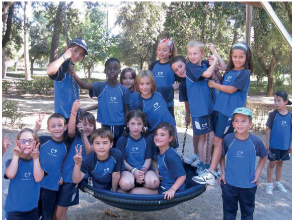
Nenes i nens al col·legi l'any 2011